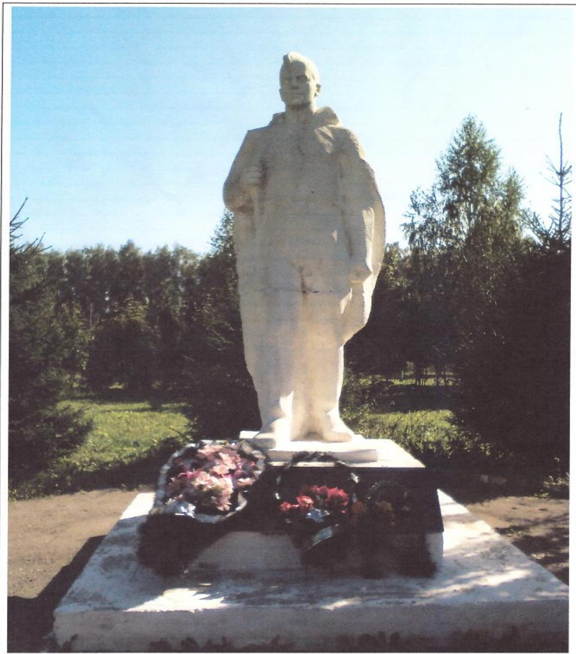
Символизирующий памятник погибших в годы ВОВ. Фамилии восстановлены в 3 военкоматах – Захаровском, Старожиловском, Михайловском. Все фамилии погибших занесены в областную Книгу Памяти и указаны на мраморной доске.