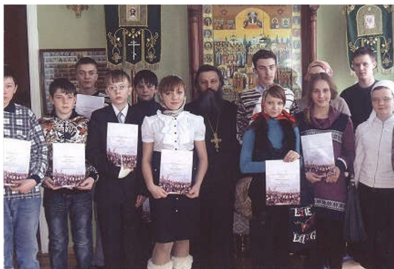
2012 год. Православная гимназия во имя святителя Василия Рязанского. Региональный этап олимпиады по ОПК

Проведение олимпиады нацелено на решение актуальной задачи формирования нравственных и духовных ценностей обучающихся в системе общего образования. В нашей школе реализуется преподавание основ православной культуры в урочной, внеурочной и факультативной форме. Обучающиеся включаются в Олимпиаду как в звено общей цепочки знаний по православной культуре. Проведение олимпиады способствует духовно-нравственному становлению личности ученика и учителя. К участию обучающихся готовят учителя начальных классов, истории и обществознания, русского языка и литературы.