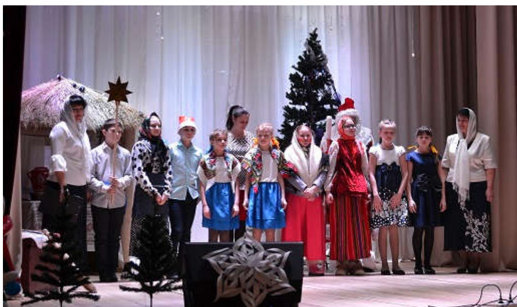
Праздник «Рождество Христово» 2017 год (Приложение 11)