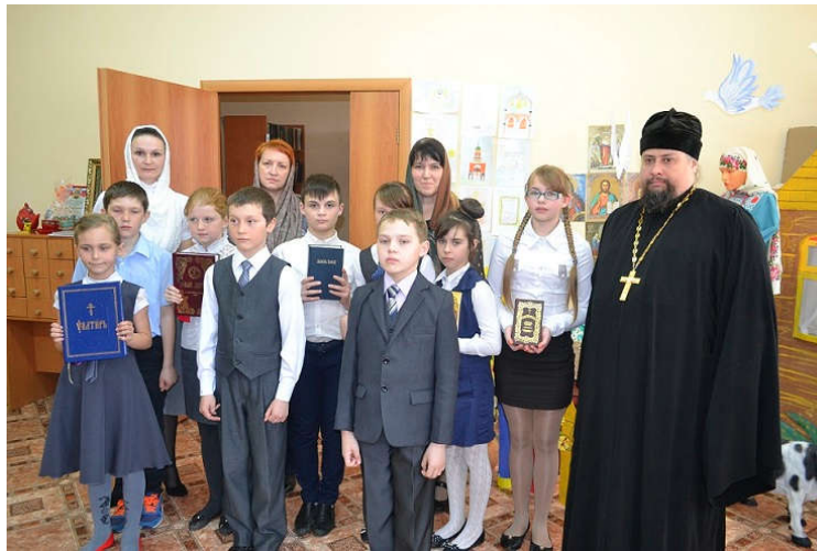
День православной книги в сельской библиотеке с.Малинищи 2016 г.(Приложение 13)

В 2018 году в мероприятиях приняли участие 128 человек с 1 по 11 класс.