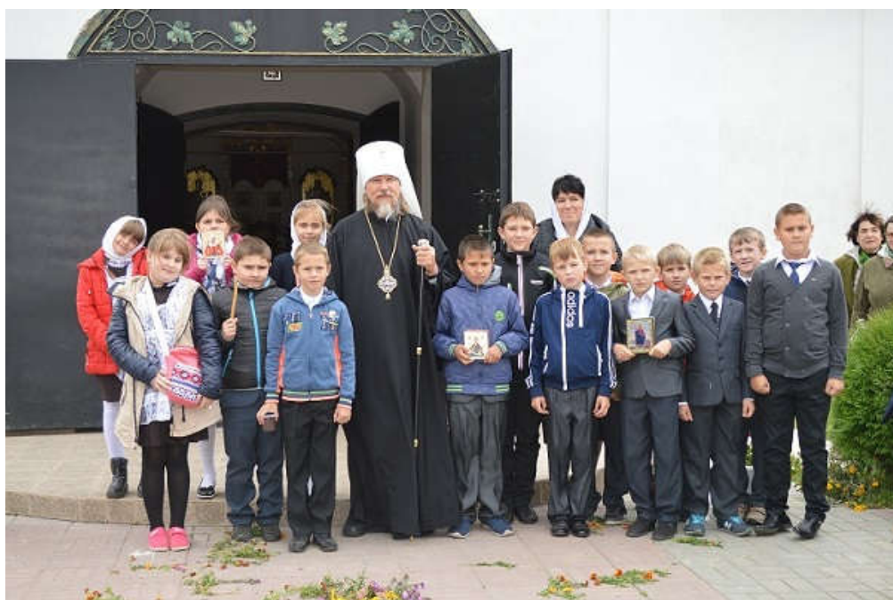
26 сентября 2017 г. Храм Воскресения Славущего. Панинская слобода, Старожиловский район, Рязанская область. С митрополитом Рязанским и Михайловским Марком