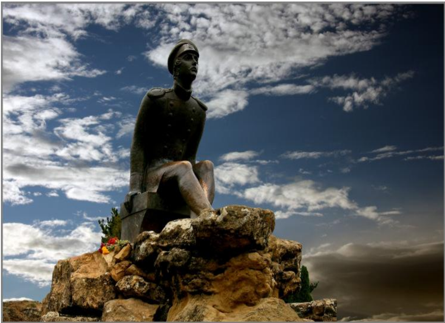
Памятник М. Ю. Лермонтову на Кавказе