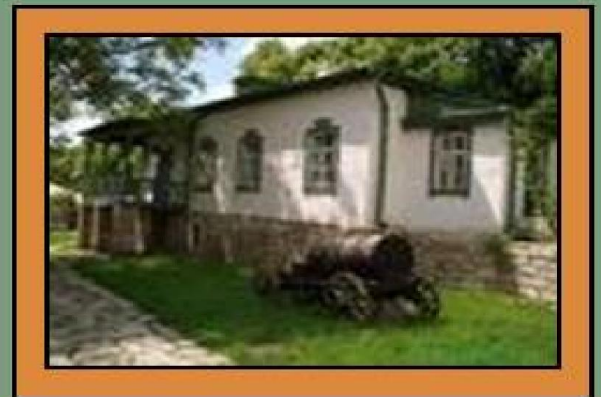
Домик М.Ю. Лермонтова

к народному ее пониманию: М.Ю. Лермонтову чужда была любовь помещиков к своим крепостным вотчинам, их вера в непоколебимость крепостного права, поэт понимает любовь к отчизне истинно, свято, разумно, а не как гражданский долг, для него понятие родина сливается с понятием народ.